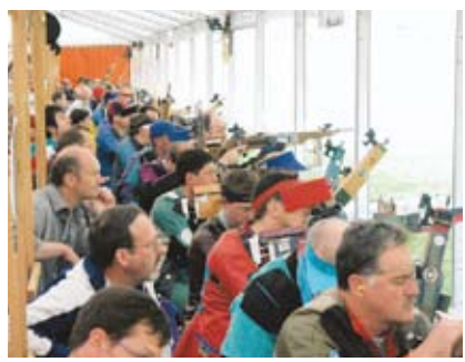
Es werden rund 1500 Armbrustschützen erwartet.

ÄGERI Vom 23. Juni bis 3. Juli findet das 22. Armbrustschützenfest im Ägerital statt. Gleichzeitig