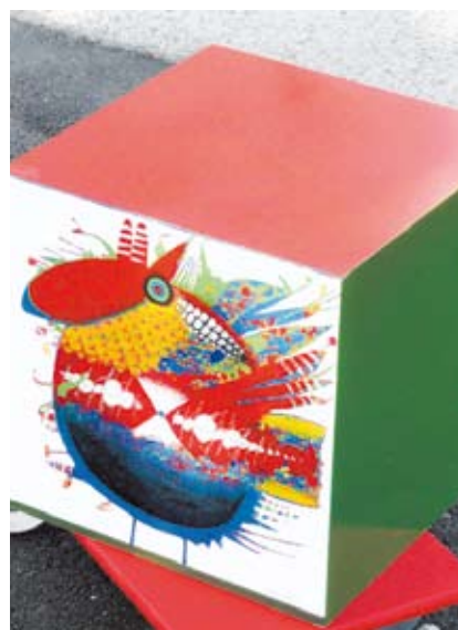
Ersteigern Sie z. B. ein Original von Elso Schiavo für Zuhause.

Erlös für das Spielplatz-Projekt Die Werke der Kunstschafter sowie 30 von Sonnenberg Schülern