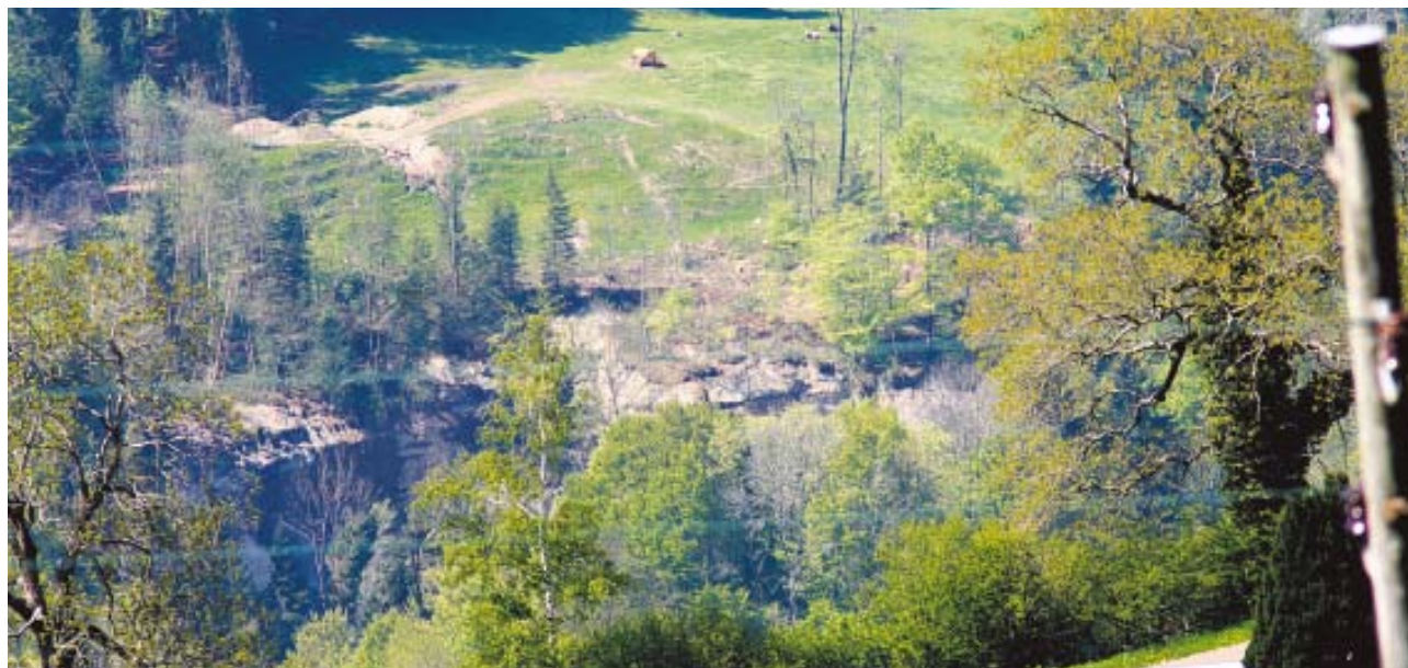
Der Lorzentobelhang ist nach wie vor instabil, es ist also - trotz offenen Wegen - nach wie vor Vorsicht geboten.

Es ist weiterhin Vorsicht geboten Sollte sich die Gefahrenlage aufgrund von Regenfällen oder anderen Ursachen erneut verschärfen, so die Baudirektion, müssen einzelne Wege eventuell wieder gesperrt werden. Die kantonale Arbeitsgruppe Lorzentobel rät auf jeden Fall, die Wege im Lorzentobel nicht zu verlassen und die Abschränkungen zu beachten.